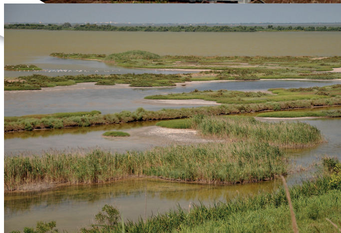
Vand, vand og atter vand i alle mulige farver så langt øjet rækker.

Ind imellem lå der store marker og kæmpe store gårde; vi har læst, at hele Po's flodleje ernærer omkring en tredjedel af Italiens befolkning. Men det skulle også dække 15 % af landet.