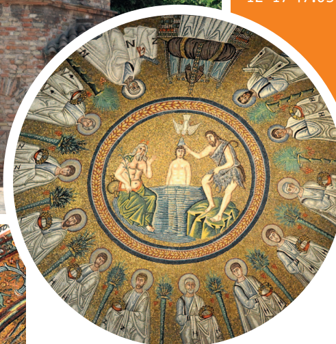
Dåbskappellets smukke, runde mosaik gengiver Kristi dåb, overvåget af de 12 apostle. Det nederste billede viser den rige mosaikudsmykning af Basilica di San Vitale, ligeledes fra 6. årh.