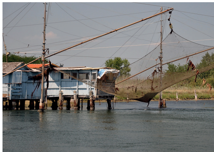
Store, kvadratiske net sænkes med et spil ned på flodbunden.