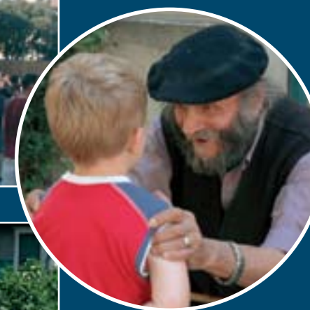
"Glæder du dig til, at cykelrytterne kommer til Maussane?" "Mon ikke det er noget i den retning, den gamle siger til knægten?" "Vi mødte den gamle mand næsten hver dag, når vi fra campingpladsen gik en tur ned i byen."