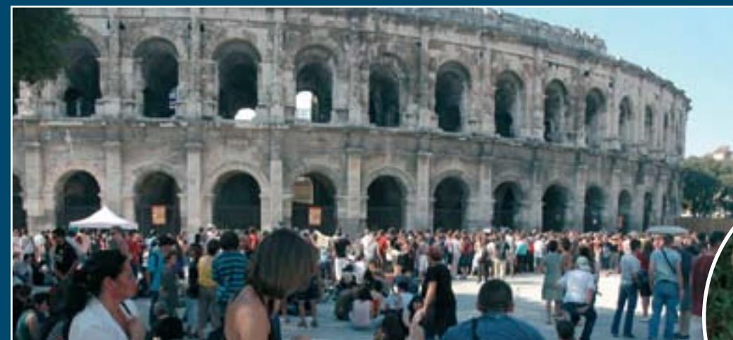
Den dag i dag bruges amfiteatret i Nîmes til alle mulige forestillinger, - ligesom for 2.000 år siden. Her venter publikum på, at portene bliver åbnet til en rockkoncert.