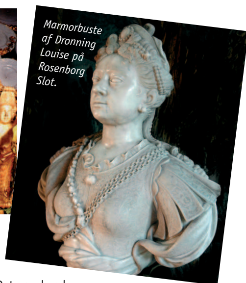
Marmorbuste af Dronning Louise på Rosenborg Slot.

paa hvilke Roerskarlene vare klædte i Republiques Liberie". Ud over det overdådige kulinariske overflødigehorn inkluderede gaven 250 stk. kostbare, venetianske glas.