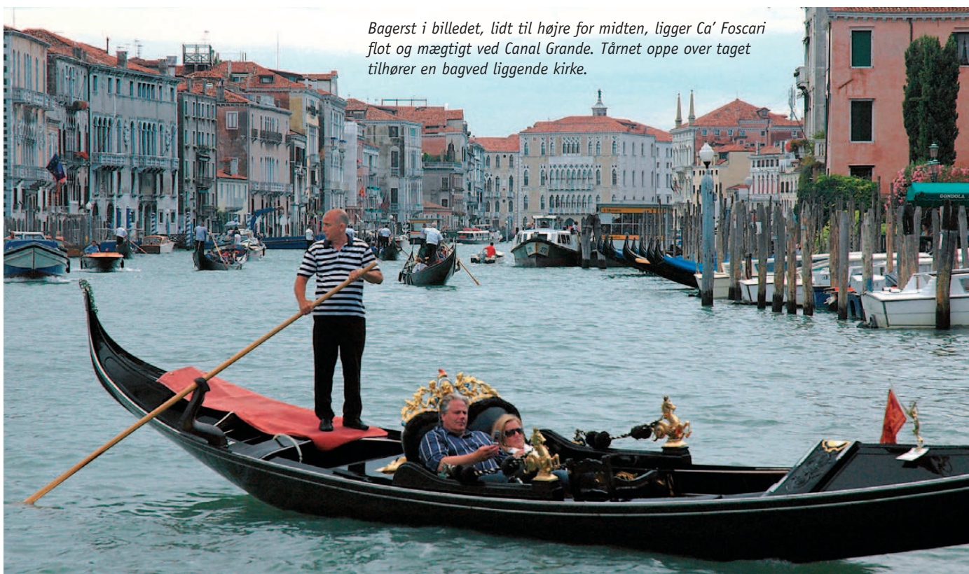
Bagerst i billedet, lidt til højre for midten, ligger Ca' Foscari flot og mægtigt ved Canal Grande. Tårnet oppe over taget tilhører en bagved liggende kirke.

Ved modtagelsen modtog Frederik en såkaldt Rinfrésco, en kostbar forfriskning til 2000 dukater, der beskrives som "en fortræffelig Present af allehaande Forfriskninger og andre Ting, som alt sammen blev overbragt i 12 smukke Barquer,