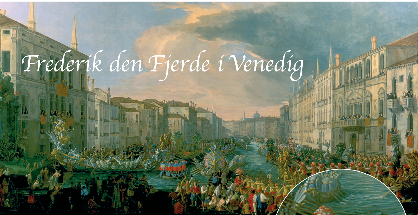
Carlevaris' store maleri af regattaen, afholdt til Frederik 4.s ære. Udsnittet viser kongen sammen med en kavalier, begge med trekantede hatte.

hvor alt skal gå så pokkers hurtigt og effektivt med e-mail, videokonferencer, sms'er, fax, direkte TV fra Folketinget osv. er det svært at forestille sig, hvordan det har ladet sig gøre at styre landet på datidens vilkår – og så på den afstand. Kong Frederiks afrejse fra København havde været dybt hemmelig. Alle deltagere og deres pårørende var i tiden op til afrejsen formanet om at iagttage den største diskretion. Ingen måtte få nys om noget som helst. Datidens presse var pålagt ikke at beskrive hans afrejse eller formålet med den kostbare odysse, - hvilket blev respekteret. En tavshed, der er utænkkelig i vore dage, hvor stort set alle i pressen tør, - og ingen tier! Først en måned efter, at Frederik med sit følge havde forladt landet, skrev Nye Tidender i en kort notits, at kongen var afrejst for bl.a. at besøge sin et år ældre fætter August den Stærke i Leipzig. Her skulle han overrække fætteren Elefantordenen.