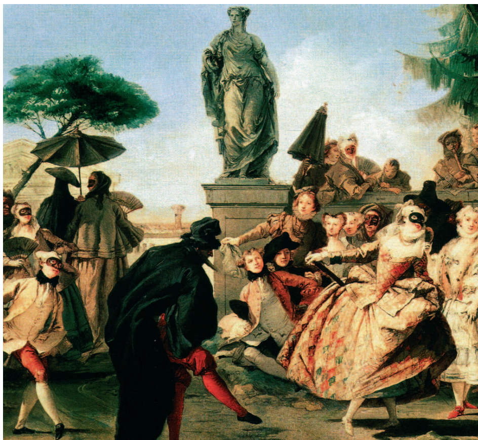
Maskerade på venetiansk maleri fra 1700-tallet. Lige noget for Frederik 4.

Frederik bar stadig det lille sølvkrucifiks på sig. For rejsemålet var, som nævnt tidligere, Firenze, hvor kongen håbede på et kærligt gensyn med sin ungdoms elskede, Teresa Trenta.