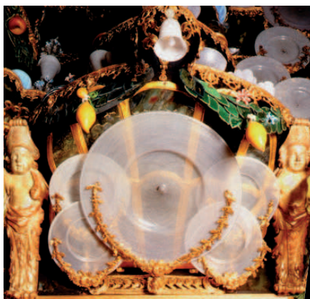
Fra glaskabinettet på Rosenborg.