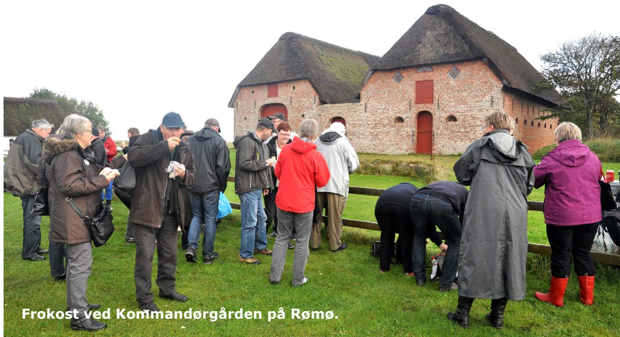
Frokost ved Kommandørgården på Rømø.