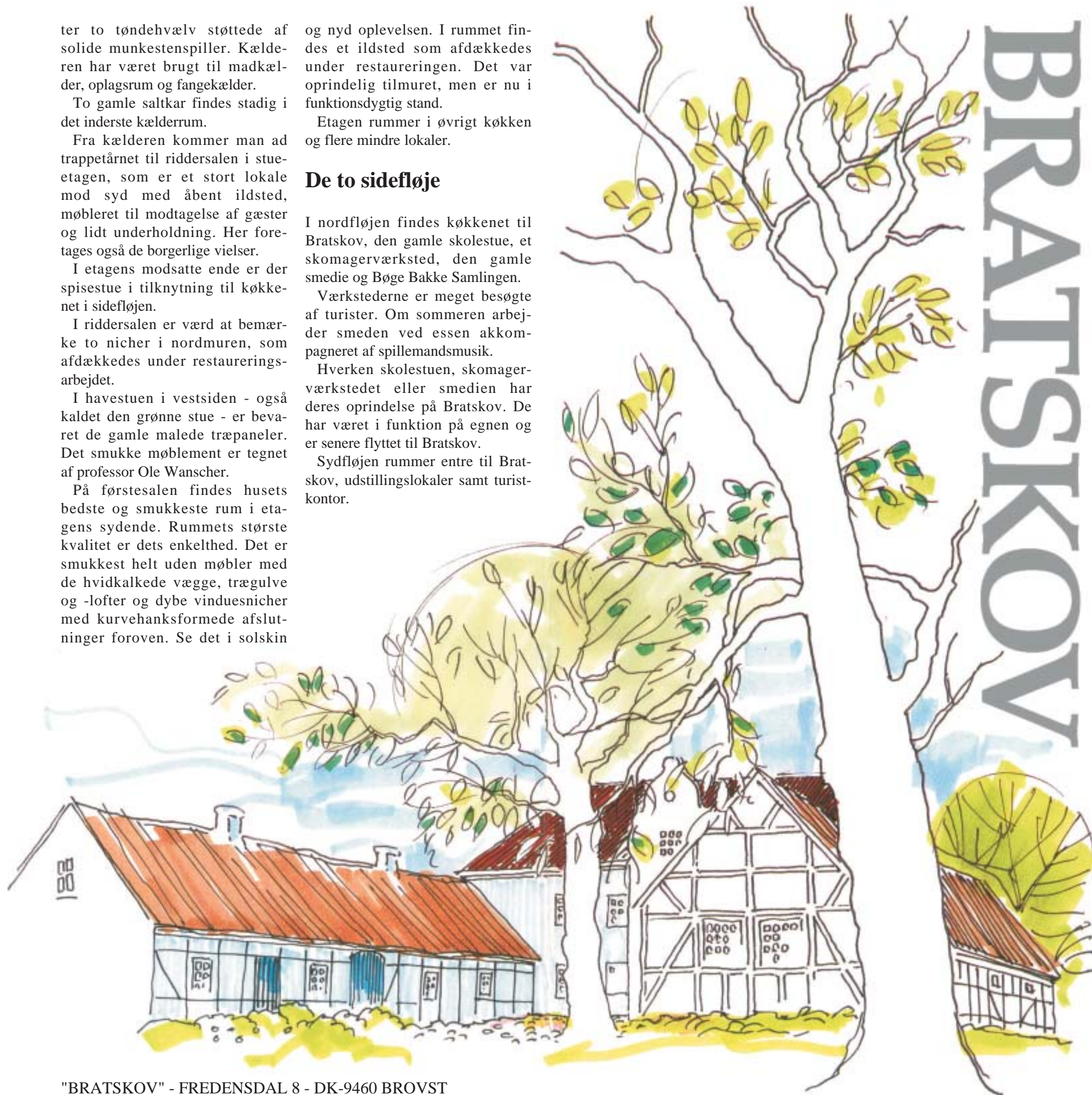
"BRATSKOV" - FREDENSDAL 8 - DK-9460 BROVST