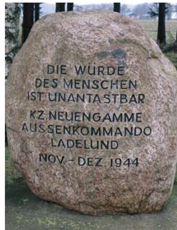
KZ-lejren lå et par km nord for landsbyen Ladelund. I dag er der en mindelund. Mindestenen bærer teksten "Menneskets værdighed er ukrænkelig" - artikel 1 i den tyske grundlov fra 1949.

At udstillingen ligger ved siden af kirken, er ingen tilfældighed, fandt vi ud af. Det var nemlig her, ofrene fra lejren blev begravet. Udstillingen er en studiesamling, som til stadighed