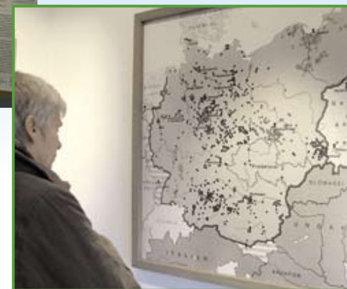
En planche viser Nazi-Tysklands kolossale net af kz-lejre - dels hovedlejre, dels de utallige underlejre, som fx Ladelund. Neuengamme sydøst for Hamborg havde 80 sådanne underlejre, såkaldte Aussen-Kommandos.