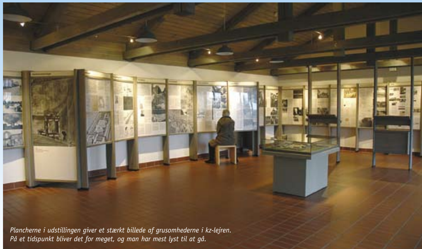
Plancherne i udstillingen giver et stærkt billede af grusomhederne i kz-lejren. På et tidspunkt bliver det for meget, og man har mest lyst til at gå.