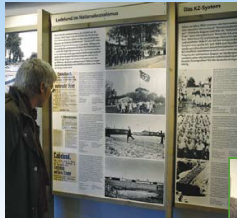
Udstillingens mange plancher forsøger ikke at skjule eller lægge låg på forholdene i 30'ernes og 40'ernes Tyskland.

Udstillingen fortæller, hvordan de forhutlede og forkomne fanger tidligt hver morgen, trods stærk underernæring og sygdom, blev kommanderet ud nord for landsbyen for med håndkraft at grave den dybe grøft. Tegninger og samtidige fotografier viser, at panserspærringen endte med at være 4-5 meter bred og over 3-4 meter dyb. Den strakte sig de 14 km fra Ladelund til Süderlügum. Man kan endnu enkelte steder