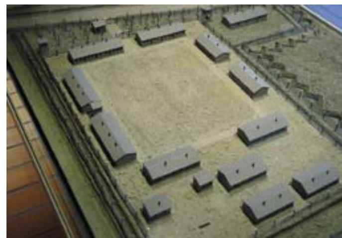
Model af kz-lejren. På så lidt plads blev 2.000 fanger holdt indespærret. Vejen øverst i billedet er landevejen mellem Ladelund og grænseovergangen til Danmark ved Pebersmark.

godt klar over, at døden som oftest skyldtes underernæring eller brutal vold fra fangevogternes side. Efter krigens afslutning førte han alle navne og personlige data ind i kirkens begravelsesregister, ligesom han personligt tog kontakt til de pårørende, hvor det var muligt.