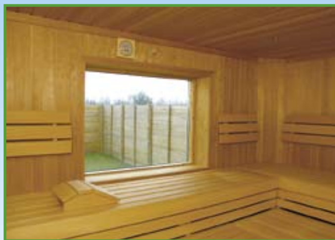
Fra den ene af Camping Mitte's 4 forskellige saunaer har man udsigt til en lukket solgård.

Svømmehallen har åbent hver dag og er meget besøgt. Der er gratis adgang for campister. Den udendørs pool har de samme mål.