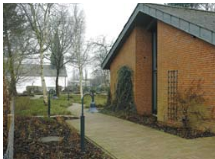
Dokumentationscentret er placeret i forbindelse med den del af kirkegården, som rummer fangegravene.

indsamler og videreformidler dokumentation om de grufulde forhold, fangerne levede og døde under.