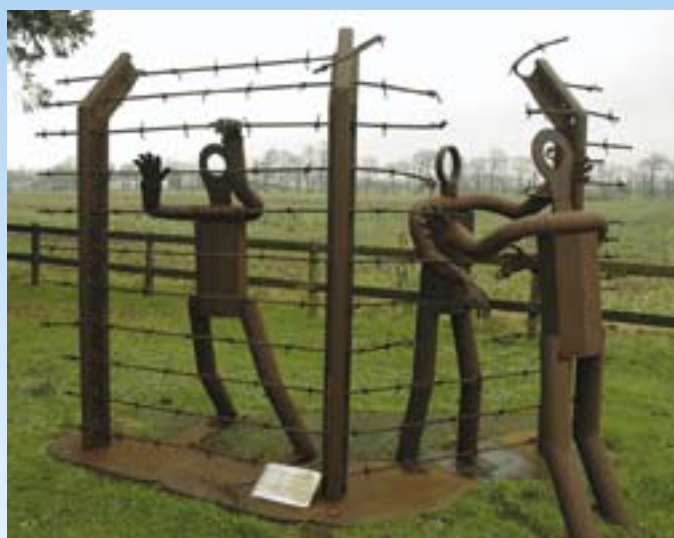
KZ-lejren lå et par km nord for landsbyen Ladelund. I dag er der en mindelund. Hvor det dobbelte pigtrådshegn engang løb, er der opstillet en stålskulptur, som i maj-juni 2002 er udført af elever på Theodor-Schäfer-Erhvervsskole i Husum. På majs-stubmarken bagved lå lejrens barakker.