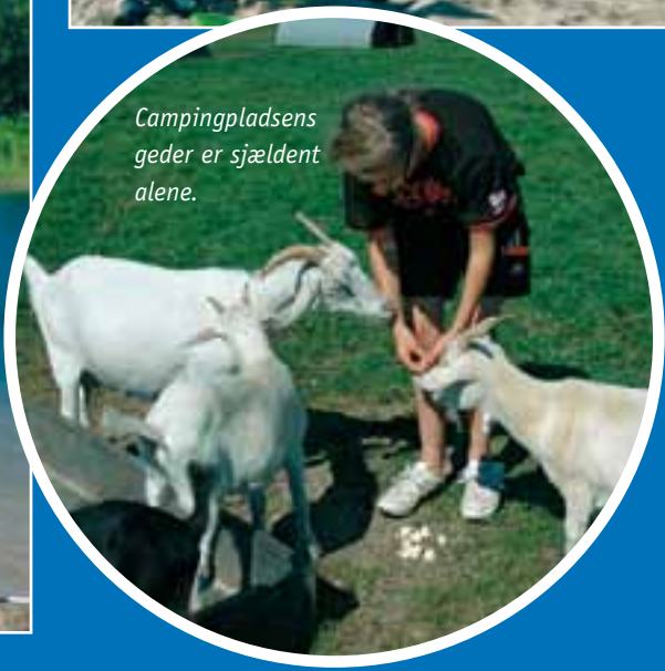
Campingpladsens geder er sjældent alene.

Ligeledes er det planen, at der skal etableres mere lys langs vejene på pladsen. Jeg kunne så tilføje, at der også gerne må placeres nogle flere vandposte rundt på pladsen - fx en i hvert afsnit. Hvis man nu alligevel skal til at grave kabler ned til belysning.