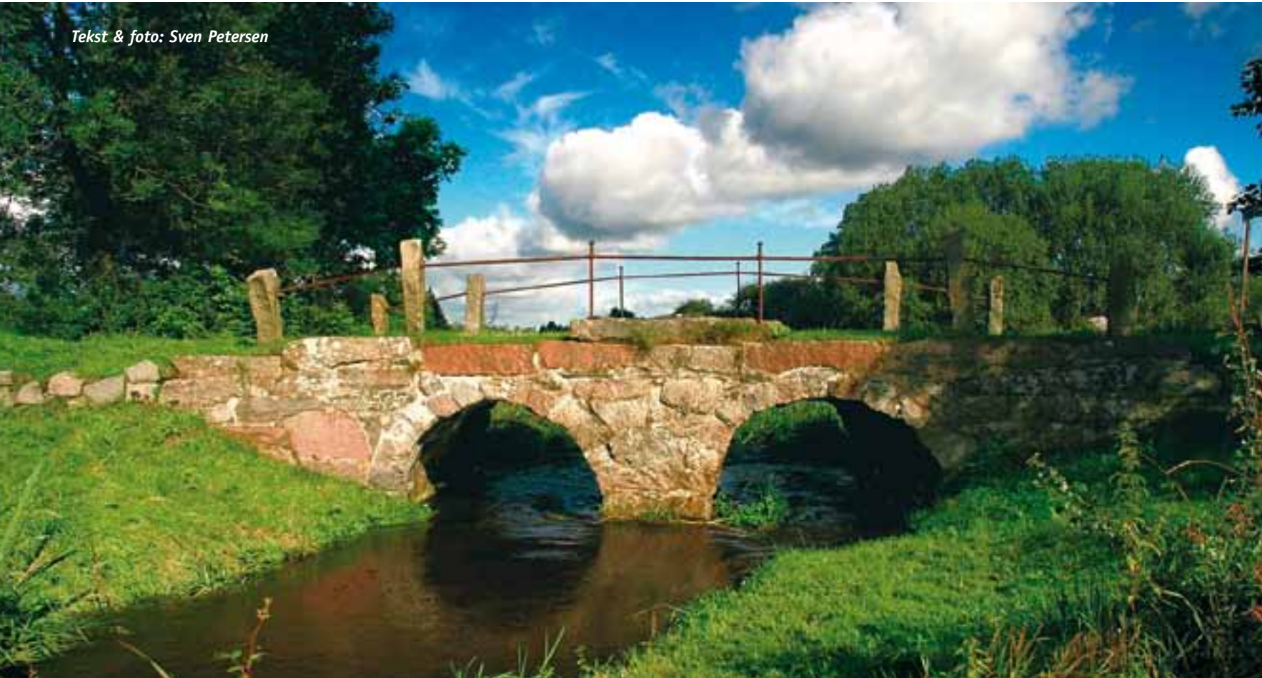
Den utroligt smukke Gejlå Bro i Bommerlund er fra 1818.

Uge Lystfiskeri & Camping er en af de første campingpladser på dansk jord, man møder, når man ved Frøslev er kommet over grænsen på vej hjem efter en dejlig ferie sydpå. Det er i hvert fald sådan, vi lærte pladsen at kende.