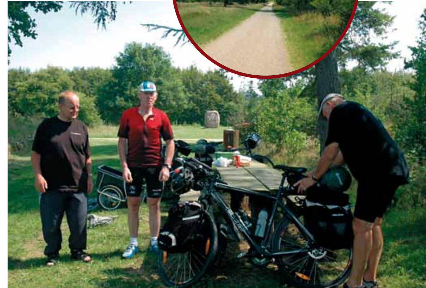
Tre friske cykelcampister fra Hobro på Hærvejen i Bommerlund Plantage. I baggrunden Bommerlunder-stenen.

Som det fremgår af pladsens navn, spiller lystfiskeri en stor rolle på campingpladsen. Gennem mere end 50 år har der i området været et utal af større og mindre grusgrave. Når der ikke kan indvindes mere sand og grus, er det ikke ualmind-