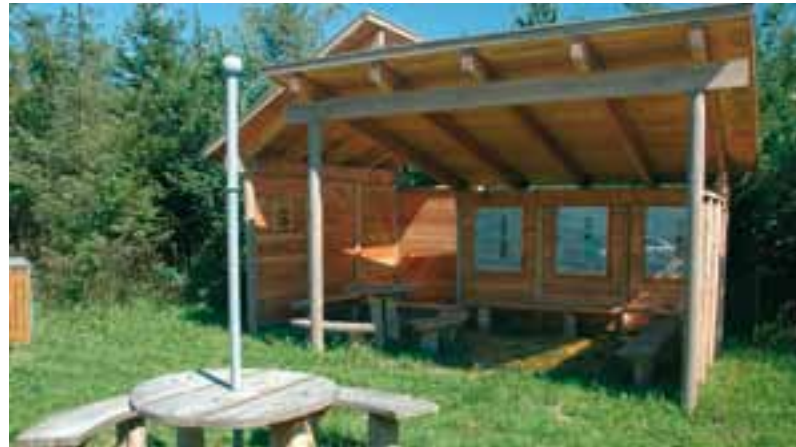
Pilgrimshytten i Urnehoved er bygget af meget gedigne materialer til et hvil.

De er flækket ud af den samme, enorme vandreblok. Virkelig imponerende! I dag er den tidligere vandrige å omlagt og