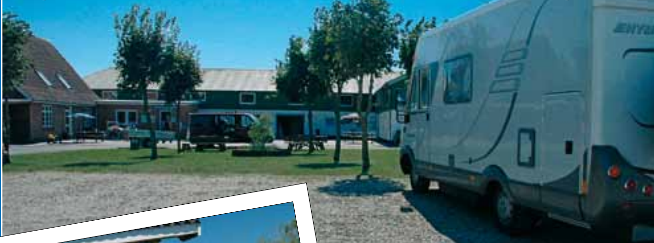
Reception, butik mv. er indrettet i de tidligere landbrugslænger.