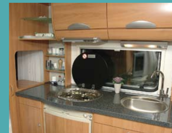
Min kone mener, en kvinde har haft en finger med i spillet. Bedre arbejdsplads skal man lede længe efter. Bemærk den lækre, højglans skinnende "granit"-bordplade.