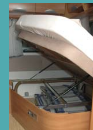
Hymer er vist ene om at have et senge-understel, som er smedet i stålror.