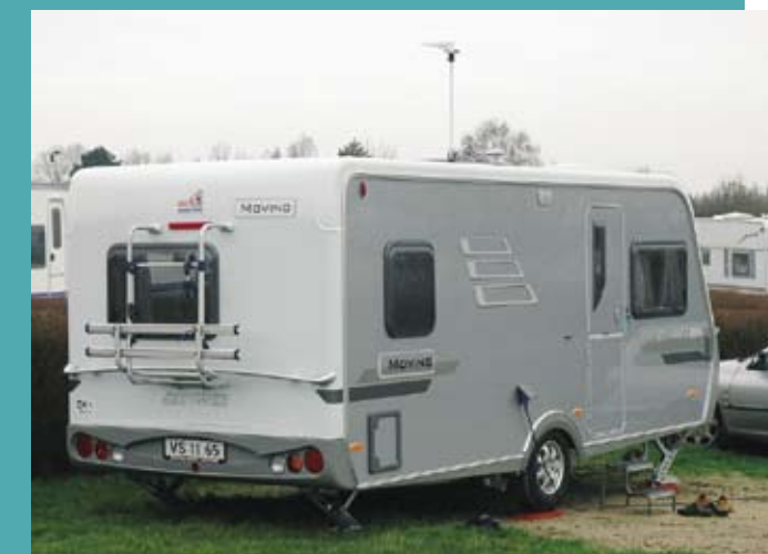
Støttebenene er skruet ned for allerførste gang på en campingplads - et stort øjeblik!