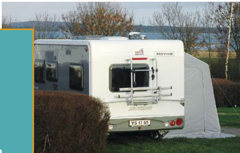
FDM Camping Holbæk Fjord, før nytårsstormen rigtig tog fat.

Men inde i den lune vogn herskede ro og idyl, mens det pib om ørerne udendørs. Med en udetemperatur på 4-7 grader kunne vi med Ultraheat'en på 1000w holde en komfortabel indetemperatur på 20-22 grader. Ingen træk fra døren, vinduerne eller andre åbninger.