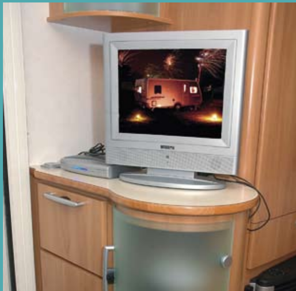
Lige inden for døren står tv-møblen i perfekt afstand fra rundsiddegruppen. Der er plads til både DVB-T receiver plus fladskærm, - men der er kun ét stik.