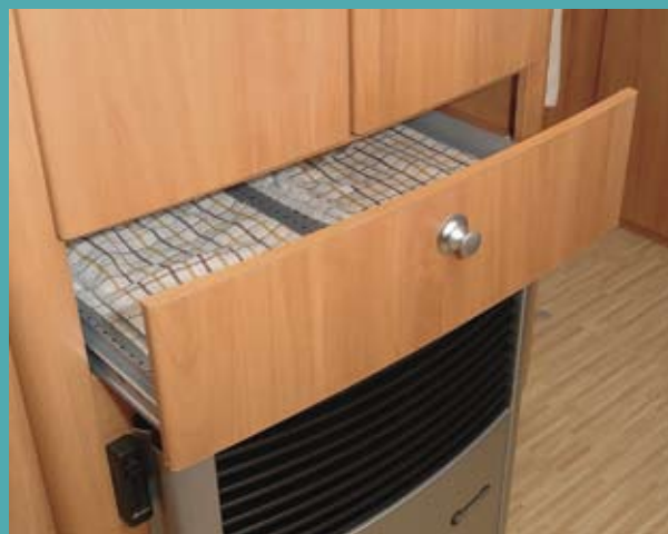
I tørreskuffen tørrer håndklæder og viskestykker på et par timer.

fantastisk i den nye vogn. Et tegn på Hymer'ens enestående håndværksmæssige kvalitet kan man finde under sengen og i magasinerne i rundsiddegruppen. Begge steder er understellet fremstillet af stålør! Lang levetid og god sove- og siddekomfort skulle være sikret.