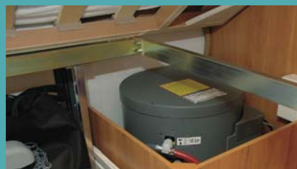
Den store 10 liter Truma boiler er forsvarligt buret inde.

Sengen er et mesterstykke med en virkelig god madras. Om det var den gode stemning på pladsen i Holbæk, eller det var sengens kvalitet, der gjorde det, ved jeg ikke. Men vi sov helt