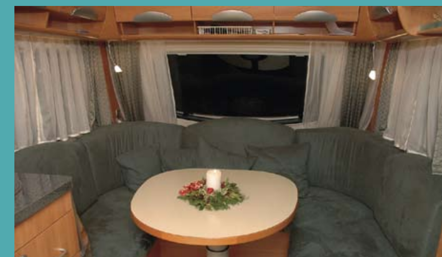
I rundsiddegruppen er der mulighed for flere forskellige former for belysning, fx hyggelys fra lyslange, gemt under overskabene. Samme mulighed er der over sengen.