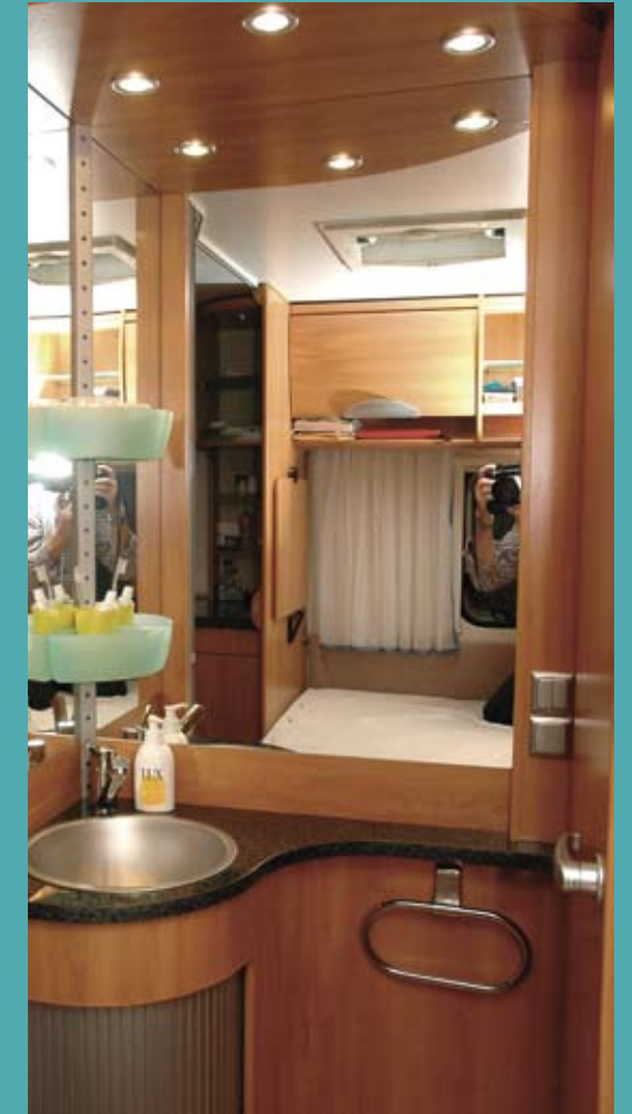
Der er skøn varme i gulvet ved håndvasken uden for toilettet.