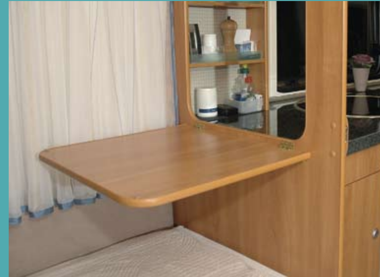
Køkkenbordets forlængelse er den perfekte morgenbakke.

Køkkenbordet er som nævnt dejligt stort - det største, vi har set på en campingvogn. Oven i købet kan det udvides med en klap hen over sengen. Nu er det slut med at blive frustreret over mangel på tilberednings- og afsætningsplads, når man