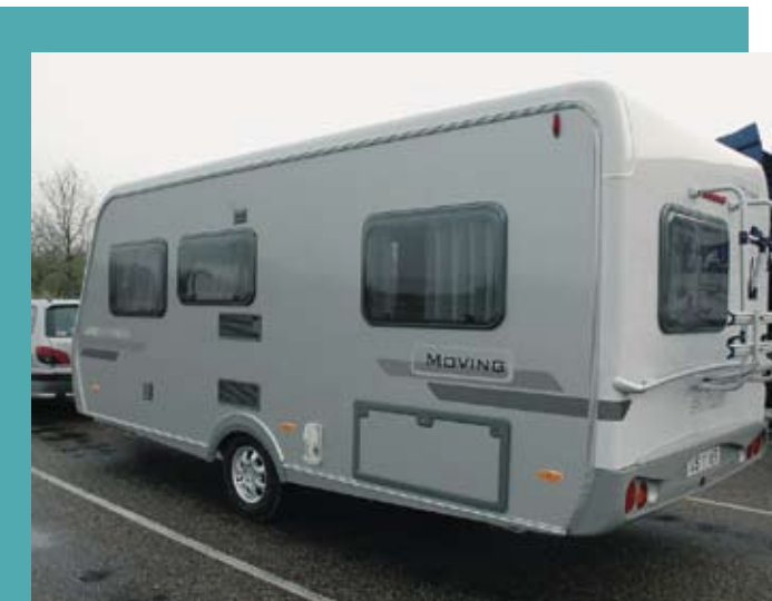
Selv om vi lige er kørt fra Neergård, skal vi lige ind på en rasteplass og beundre - og tage de første billeder af vores nye vogn.

Vore forventninger til den nye vogn var af flere grunde skruet helt op. Dels var det forventningerne til mærket, dels var det de forventninger, man helt naturligt altid har til en investering i den størrelsesorden. Som jeg skrev i forrige nummer af dette magasin, besøgte vi fabrikken sammen med Hymer Klub Danmark i efteråret 2006 og havde dér set den omhu og akkuratse, der bliver lagt for dagen ved produktionen.