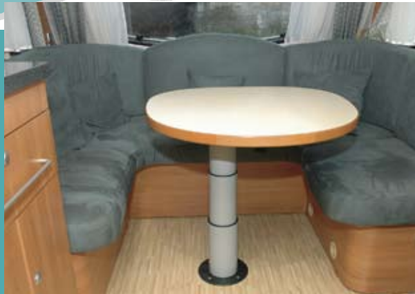
Bordet i rundsiddegruppen er utroligt let at komme rundt om. 4-5 personer har fin spiseplads her.