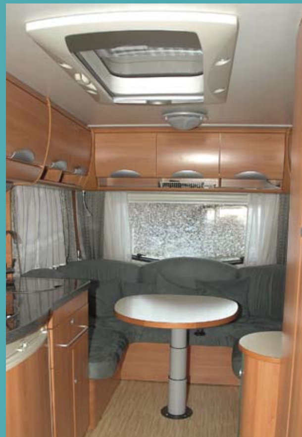
Møblernes overflader er holdt i en "træsart", Hymer kalder Lugano Pæretræ. De er behageligt lyse, men med en flot, varm tone, som bidrager til den lyse og luftige atmosfære i vognen.