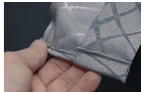
Eksempel på den høje håndværksmæssige standard: Perfekte syninger uden løse trævler.