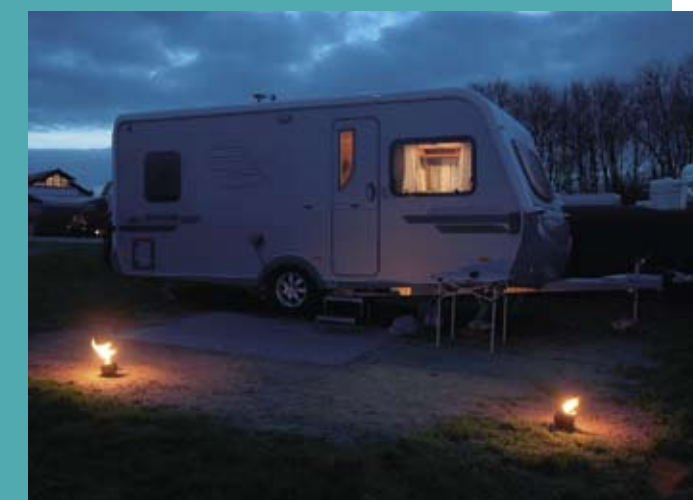
Når stormen piber om ørerne på én, så blussene hele tiden blæser ud, er der utroligt hyggeligt inden døre i en lun campingvogn!