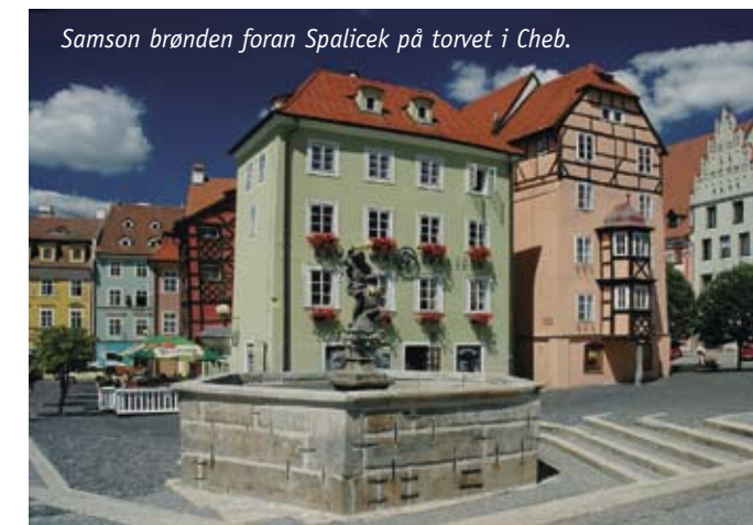
Samson brønden foran Spalicek på torvet i Cheb.

Cheb, som har 33.000 indbyggere, ligger i Tjekkiet nordvestligste hjørne. Som så mange andre byer i grænseregioner, har Cheb - som på tysk hedder Eger - op gennem historien haft en omtumlet tilværelse. Indtil 1989 lå den i et "Drei-Länder-Eck"