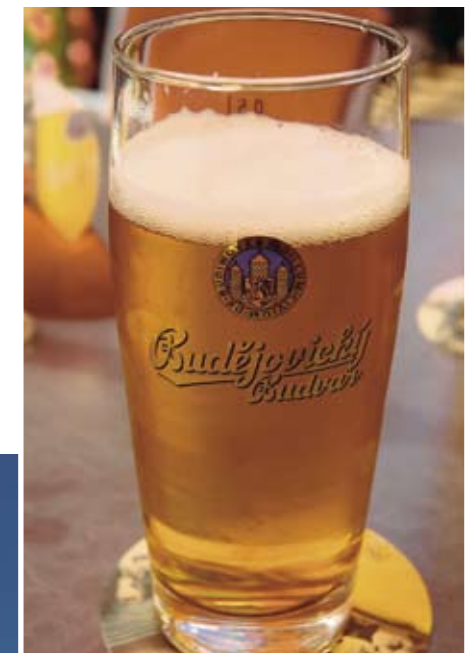
Hvis der er noget, tjekkerne er gode til, så er det at brygge dejligt, lækende øl. En halv liter tjekkisk Budweiser kostede på fortovsrestaurant, hvad der svarer til knap 7,- danske kr.!