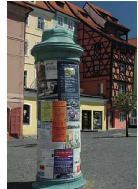
Gammel plakatsøjle foran en af de gamle købmandsgårde.