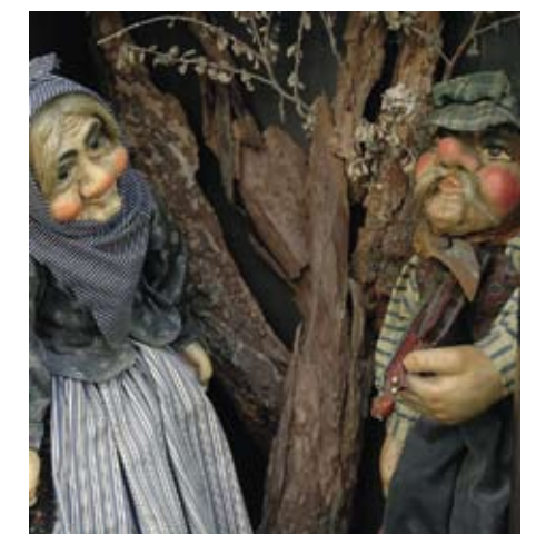
I Prag er der tradition for marionetdukker, som kan købes overalt i byen.