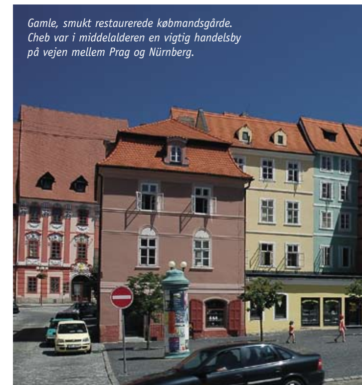
Gamle, smukt restaurerede købmandsgårde. Cheb var i middelalderen en vigtig handelsby på vejen mellem Prag og Nürnberg.