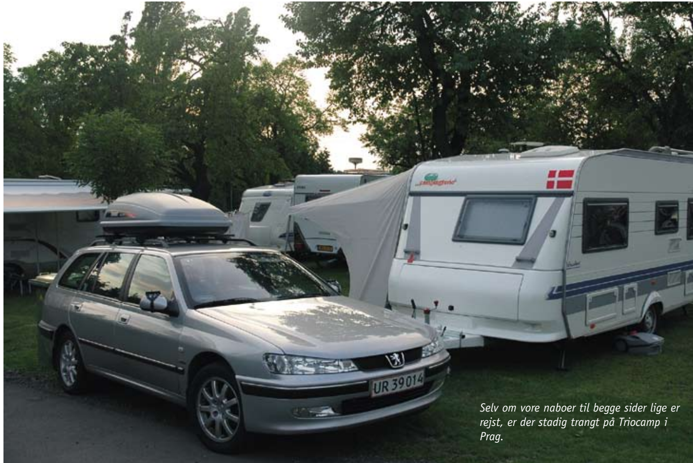
Selv om vore naboer til begge sider lige er rejst, er der stadig trangt på Triocamp i Prag.