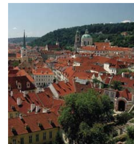
Et kig ud over de smukke, røde teglstenstage i Malá Strana, "Lillesiden" i Prag.