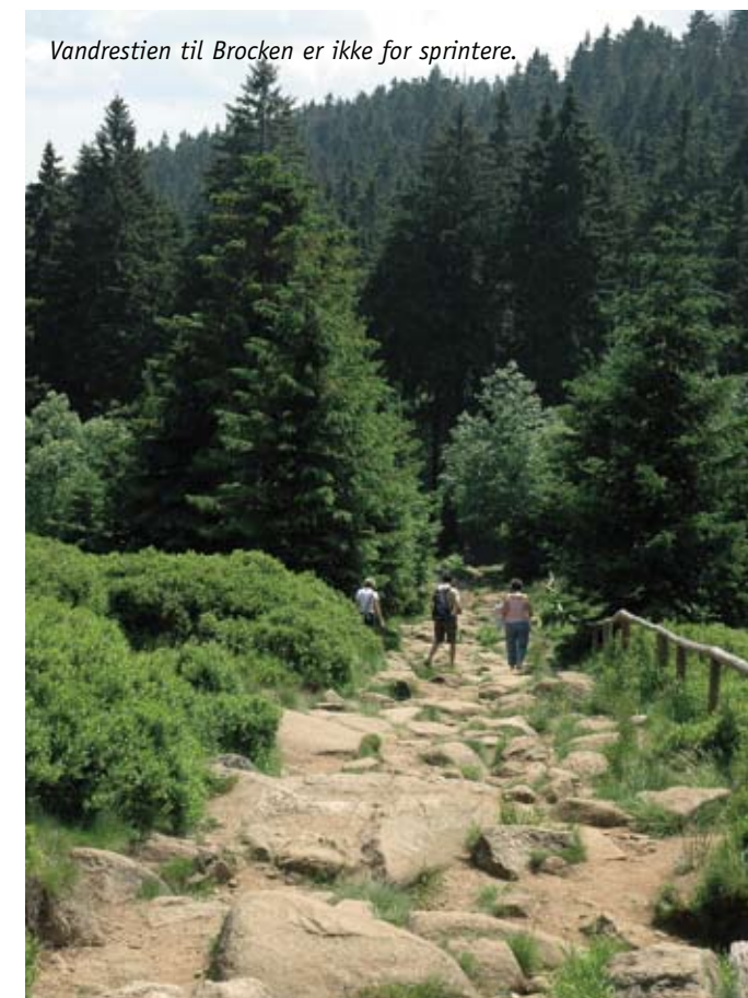
Vandrestien til Brocken er ikke for sprintere.