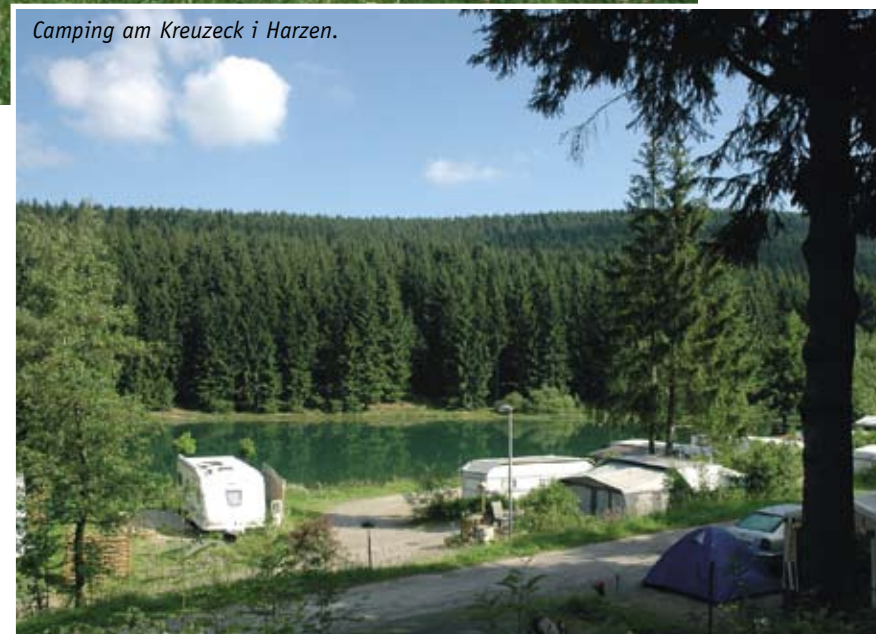
Camping am Kreuzeck i Harzen.

På vejene så man jævnligt store autotransporter, læsset med brugte biler. På åbne marker og på industrigrunde i byernes udkant lå brugtvognshandler med et lille salgsskur. Biler, vesteuropæerne ikke længere gad køre i, var bedre end de pruttende og osende Trabant'er og Wartburg'er.