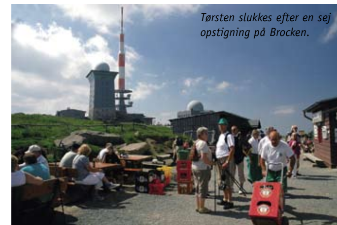
Tørsten slukkes efter en sej opstigning på Brocken.