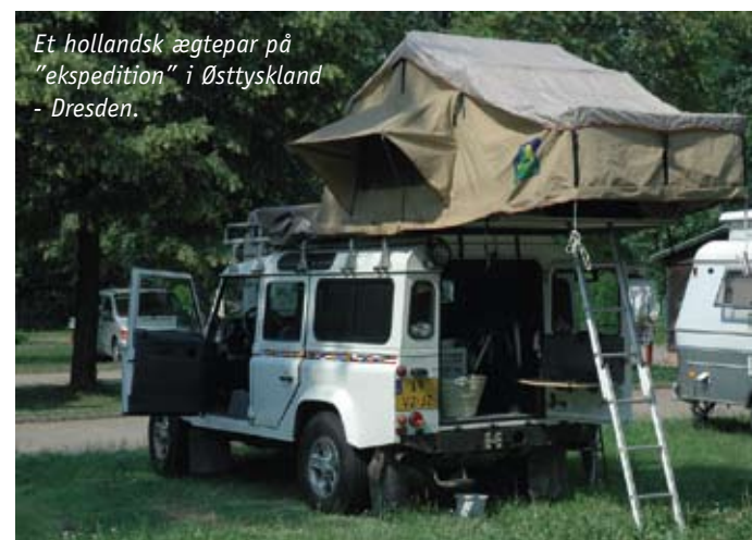
Et hollandsk ægtepar på "ekspedition" i Østtyskland - Dresden.

Det gælder fx Kulturpaladset, hvis facade rummer en tidstypisk propagandamosaik i bedste socialistiske stilart. Gudskelov har frisen fået lov at blive på sin plads. Med Camping Mockritz som udgangspunkt kørte vi en dag små 20 km sydpå til