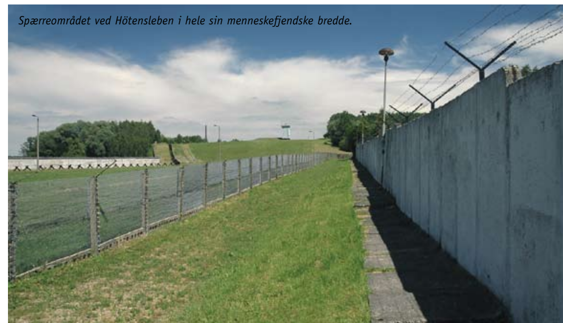
Spærreområdet ved Hötensleben i hele sin menneskefjendske bredde.

På hele turen dominerede de før omtalte vindmølleparker landskabet. Med en vis stolthed ku' vi se, at mange af dem