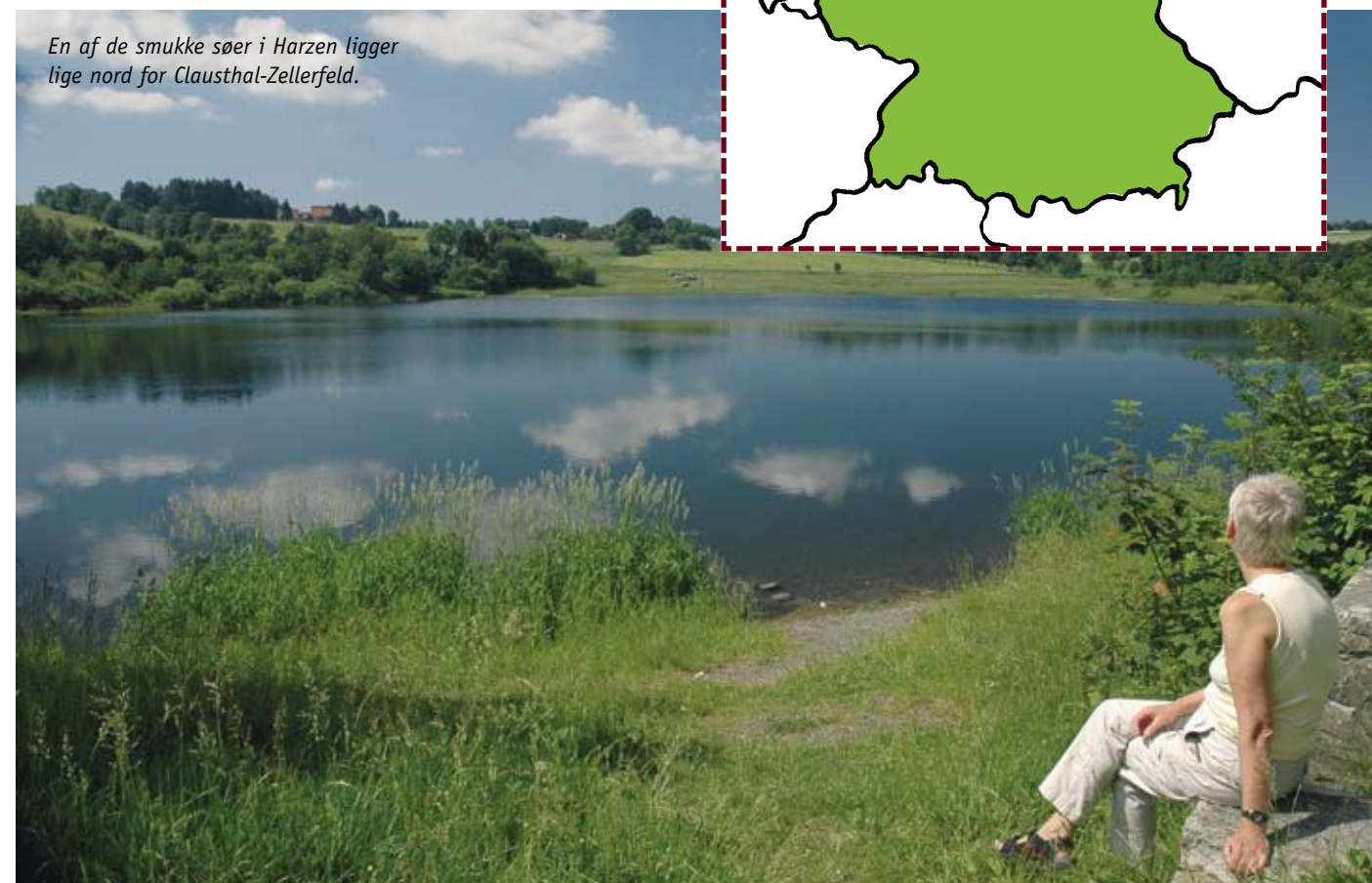
En af de smukke søer i Harzen ligger lige nord for Clausthal-Zellerfeld.

Hos Tysk Turist Information kendte man ikke noget til en vej med den benævnelse. På nettet var der heller ikke noget brugbart at finde. Lige så nedslående var det at spørge hos campingværter, turistkontorer og museer, vi besøgte i sommer. Ingen vidste noget præcist. En enkelt kunne huske, at der vist nok havde været nævnt noget i fjernsynet, - men hvad...?