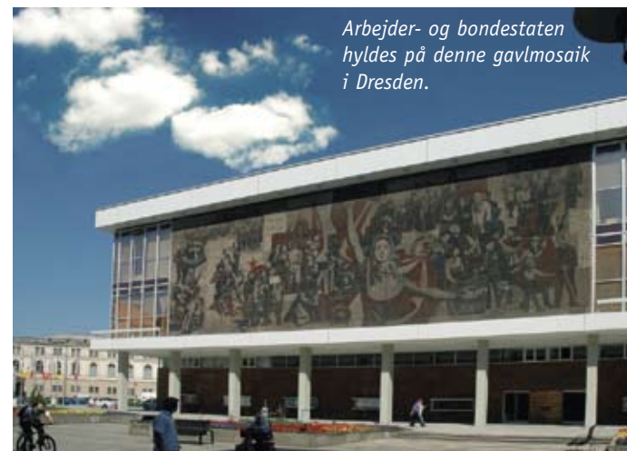
Arbejder- og bondestaten hyldes på denne gavmosaik i Dresden.

Vores plads i Dresden, Camping Mockritz, er en udmærket campingplads, som i DDR-tiden ikke var en campingplads, men en ferieby. Dresden har formået at rejse sig af asken efter 2. verdenskrigs ødelæggelser. En mængde typisk østtysk betonbyggeri kendetegner store dele af byen. Noget rives ned nu, andet får lov at stå og bliver i disse år renoveret.