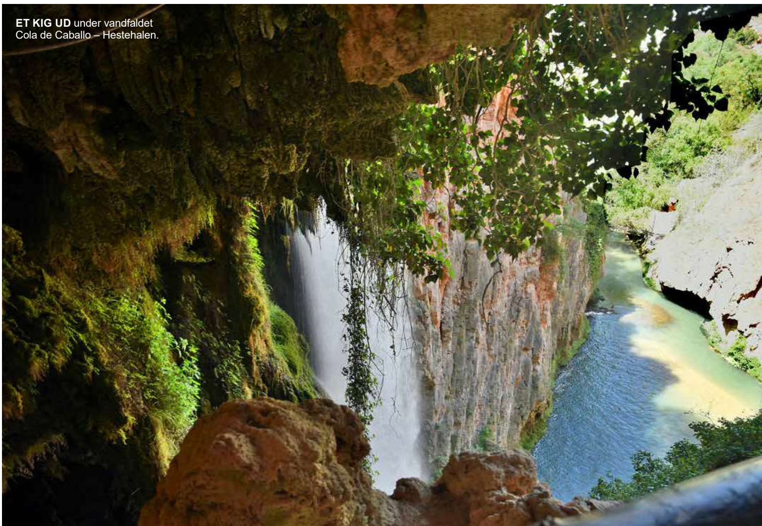
ET KIG UD under vandfaldet Cola de Caballo – Hestehalen.

Sværere var det at komme til at få lavet nogle ordentli-