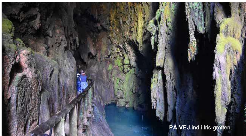
PÅ VEJ ind i Iris-grotten.

ge billeder af herlighederne; den omsiggribende selfie-dile var absolut også slået igennem her. Utroligt, så meget tid, folk bruger på at fotografere sig selv, mens man vender ryggen til motivet! Nå, det var en af mine kæpheste-undskyld!