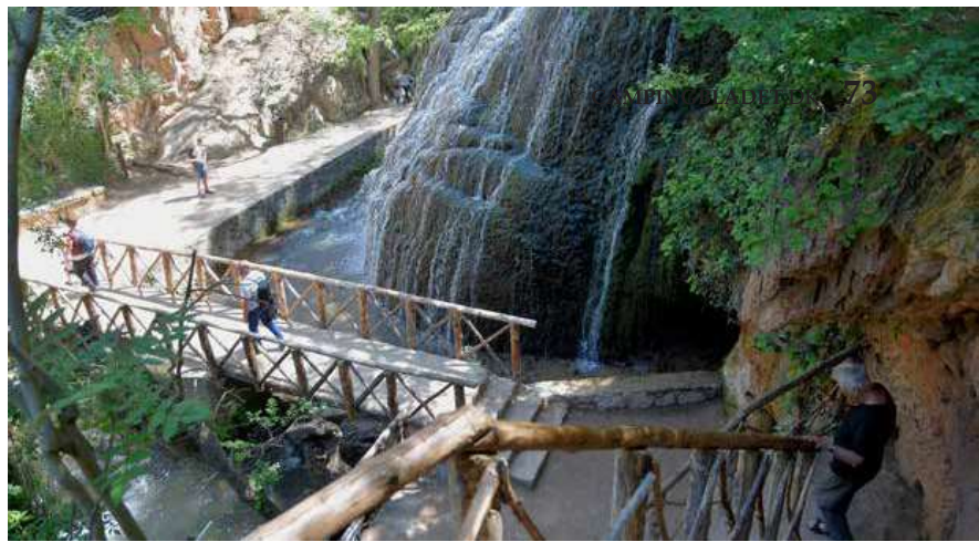
ET STORT ANTAL TRAPPER, broer og lange, våde tunneller præger parken.

er beliggende i forbindelse med et nedlagt cistercienserkloster fra det 12. århundrede, hvor der i dag er et fint klostermuseum og et hotel.