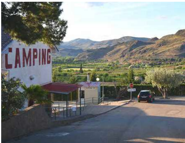
INDKØRSLEN til Camping Saviñán Park